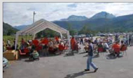
Det store teltet på Bordholmen er bare for å avlede værgudene. Det blir nok finvær!!

Senere på kvelden, og til langt på natt, spiller Dalagutan opp til asfaltdans.