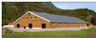
Det blir omvisning i det nye oksefjøset og hønehuset i Pestua.

Og i Pestua vil det bli høve til å sjå det nye oksefjøset som blir ferdigstilt i desse dagar, samt det nye hønehuset som vart bygd for nokre år sidan. Dette er topp moderne fjøs og ei storsatsing på ei framtid innan jordbruket.