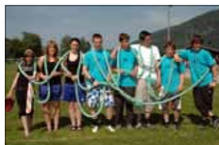
Start 4H er 40 år og har laga jubileumsutstilling i skulen.

av nytt og gammelt skulemateriell. Her vil nok mange kjenna at utstyr som balloptikon og mykje anna. Her har også Start 4H laga si