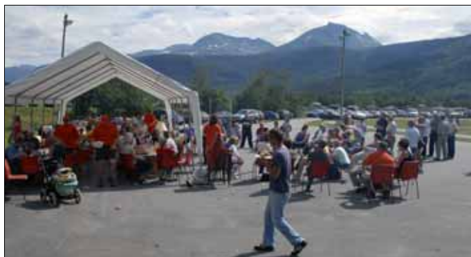
Det var eit yrande liv under Todalsdagen 2007. Triveleg å treffe gamle kjente og klassekameratar under uformelle omgivingar.

Eit av dei største arrangementa neste år er slektsstemne for alle todalingar. For; alle er vi på eit eller anna vis i slekt - om det er i gener eller noko anna som knyter oss til bygda.